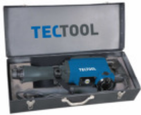
Transportkoffer inkl. Zubehör Carrying case incl. accessories Coffret de transport avec accessoires

Conçu pour les gros travaux, ce marteau piqueur est leader dans sa catégorie et très résistant, une aide précieuse pour les travaux de maçonnerie. Force d'impact de 50 Joules et 2000 tours par minute. Changement facile et rapide des burins. Poignées confortables et recouvertes d'un revêtement souple pour plus de confort. Compact, son design fluide permet de travailler dans les emplacements exigus. Inclus: Livré avec une mallette en métal incl. jeu de burins plat et pointu (Ø 30 mm, L: 390 mm).