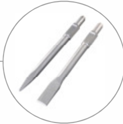
Inkl. Spitz- und Flachmeißel Incl. flat- and point chisel Incl. jeu de burins plat et pointu