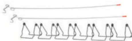
Federklemmen pinces latérales