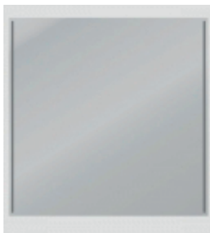
Staubschutzwand 310x310 cm Parois anti-poussière 310x310 cm

Pour cloisonner rapidement par une seule personne la zone de travaux dans un appartement. C'est pour éviter la dispersion de poussière dans une pièce. Un élément avec une porte à fermeture éclair se laisse intégrer dans ce système. La forme du mur peut être quelconque. Ce système est complètement réutilisable. Le montage se fait avec des étais télescopiques, pinces latérales et murales. Parois et portes se fixent au moyen de fermetures velcro.