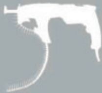
TROCKENBAUSCHRAUBER AUTO FEED SCREWDRIVER VISSEUSE À RECHARGE AUTOM.

DE MAGAZIN-TROCKEN/SCHNELLBAUSCHRAUBER TMX TBS 550 Der Trockenbauschrauber mit einem 550 Watt leistungsstarken Motor ist mit einem Schraubenmagazin von 25 bis 50 mm und einem Feststellknopf für Dauerbetrieb ausgerüstet. Dank Auto-Start-Stop-Getriebe dreht sich die Spindel erst, wenn die Schraube angesetzt wird, und stoppt automatisch, sobald sie bündig sitzt. Der stufenlos einstellbare Tiefenanschlag garantiert eine gleichbleibende Einschraubtiefe. Stufenlose Drehzahl elektronik von Stufe 1-6, Umschalter Rechts-/Linkslauf. Transportkoffer inkl. Zubehör