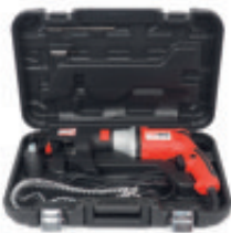
Transportkoffer inkl. Zubehör Carrying case incl. accessories Coffret de transport avec accessoires

FR VISSEUSE À RECHARGE AUTOMATIQUE RAPIDE TMX TBS 550 La visseuse à placoplâtre avec un moteur puissant de 550 watts est équipée d'un chargeur de vis de 25 à 50 mm, d'une butée de profondeur et d'un bouton de verrouillage pour un fonctionnement continu. Contrôle de vitesse électronique avec sélection de la vitesse à partir du niveau 1-6, changement à l'avant. Coffret de transport avec accessoires