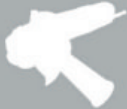
WINKELSCHLEIFER ANGLE GRINDER MEULEUSE D'ANGLE

DE KOMPAKTER WINKELSCHLEIFER TAG 900 Winkelschleifer mit staubgeschütztem 860 Watt Motor und Spindelarretierung für einfachen Scheibenwechsel.